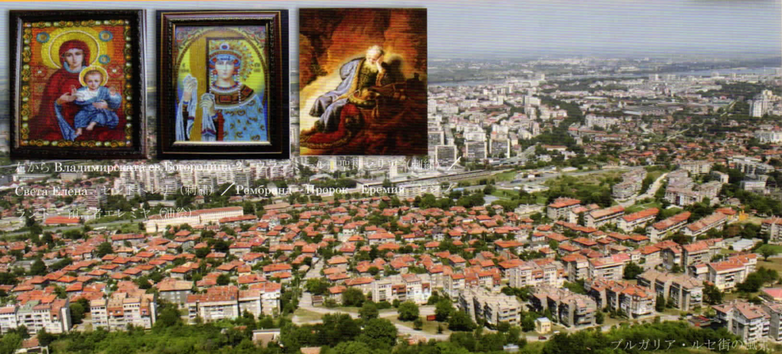
ブルガリア・ルセ街の風景