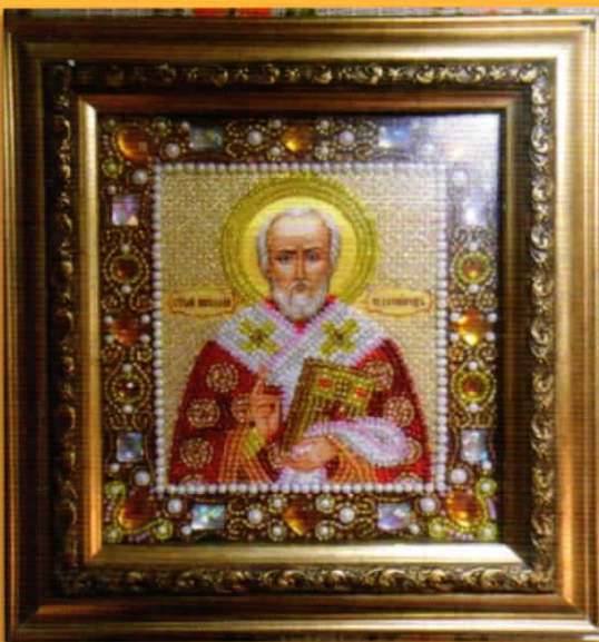
セントニコライ (刺繍)