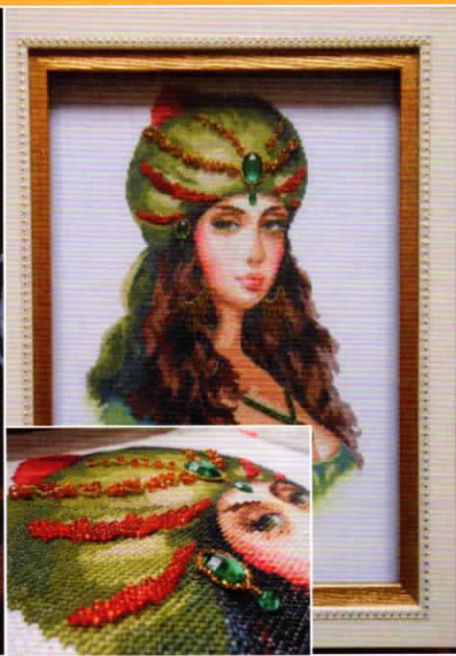
Девочката с тюрбана ターバンの少女