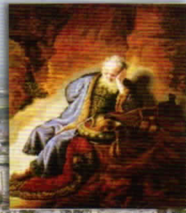
左から Владимирската е Богородица、Света Елена、セントエリザベタ、 右から Владимирската е Богородица、Света Елена、セントエリザベタ、 Света Елена、セントエリザベタ (刺繍) / Рембрандт - Пророк Еремия (油絵)